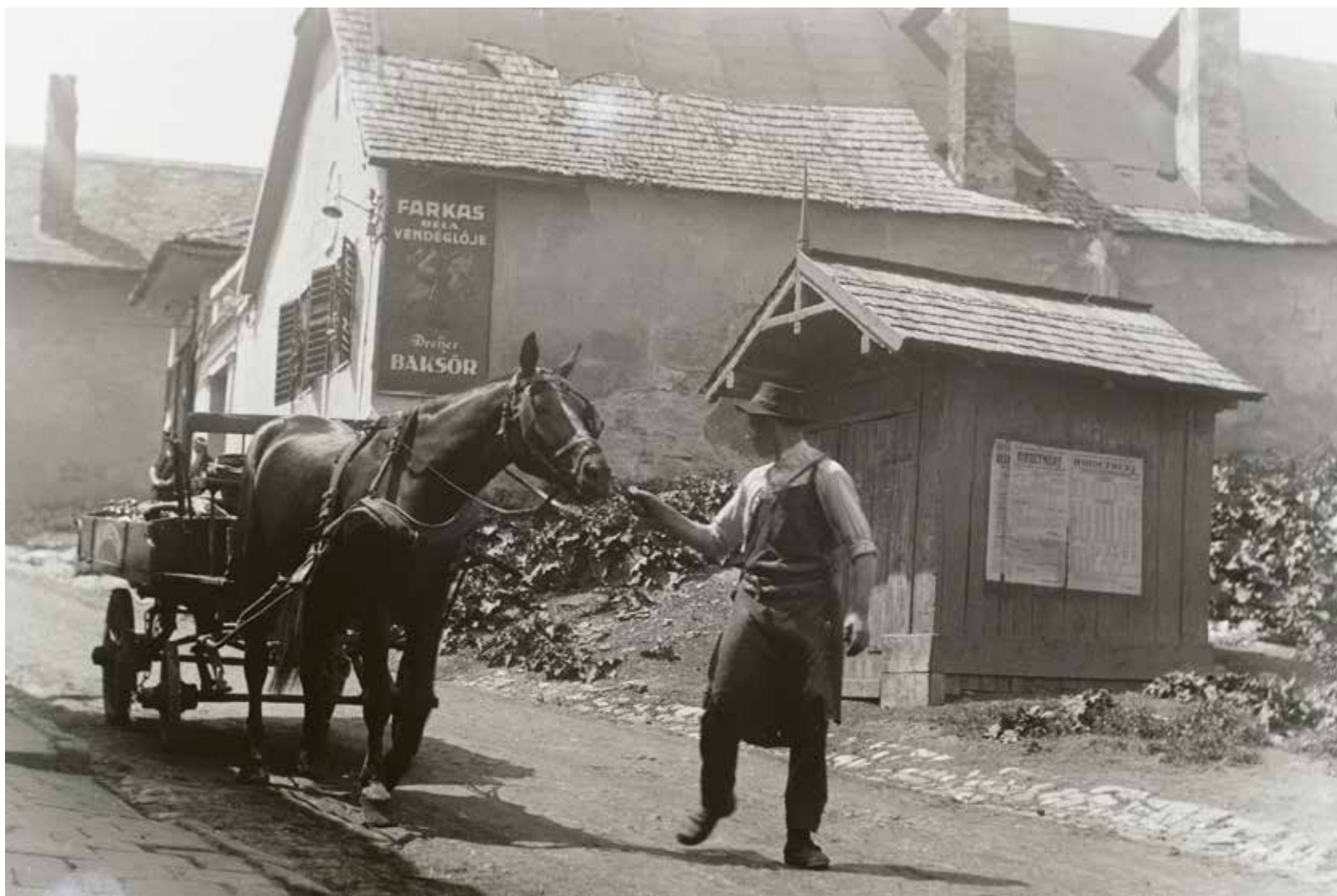
SZÓDÁS LOVASKOCSI

gül a kötetbe az egészoldalas fényképek melletti oldalra egy-egy korabeli írás – visszaemlékezés, novella-, tanulmány-, újságcikk-, jegyzőkönyvrészlet – került. A szövegek és képek mintegy nyolcvan évet ölelnek fel, az első fényképek születésétől a terület parkosításáig.