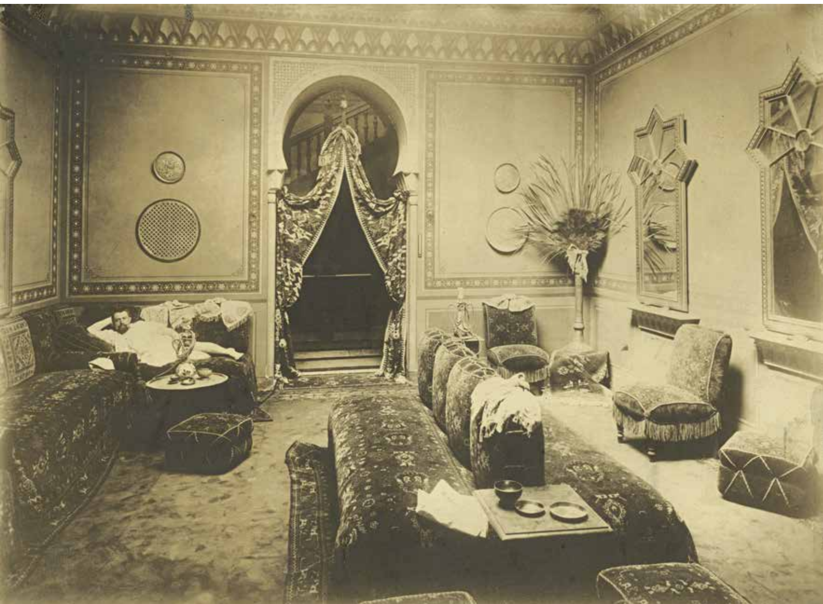
A RUDAS FÜRDŐ TÖRÖKÖS STÍLUSBAN BERENDEZETT PIHENŐSZOBÁJA 1890 KÖRÜL